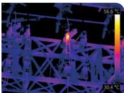
Disyuntor de subestación sobrecalentado