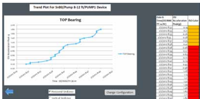
Ejemplo de un análisis de tendencia utilizando la plantilla incluida del Fluke 805.

Si las mediciones tomadas por el operario se pueden cargar en Excel, entonces la tendencia mostrará patrones que se están convirtiendo en anormales. El usuario puede tener una visión más clara del cambio de estado de los cojinetes y del deterioro del estado de la máquina.